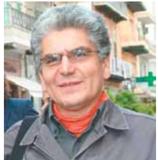
Il prof. Ignazio Buttitta dell'Universita' di Palermo e presidente della Fondazione Ignazio Buttitta.

Una settimana all'insegna della cultura si svolgerà tra la fine di febbraio e gli inizi di marzo prossimo a Toronto grazie alla collaborazione tra le associazioni "Siracusani nel Mondo" (Sicilia) e la "Siciliani nel Mondo" di Toronto. L'iniziativa, patrocini-